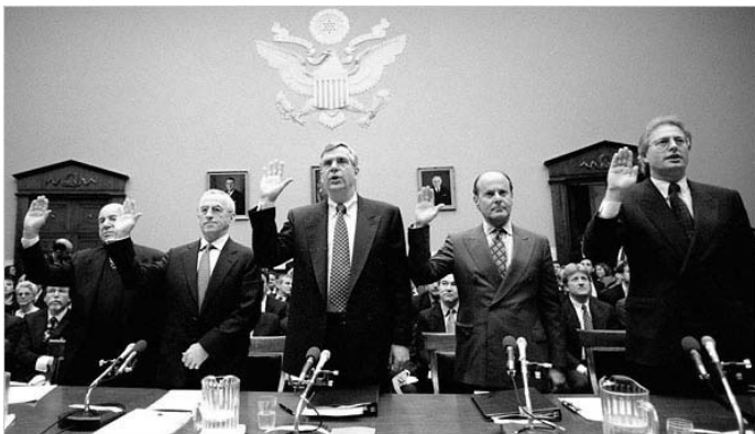
On April 14, 1994, chairmen of the leading tobacco companies testified before Congress that nicotine is not addictive.

菸草公司早在 1960 年代中期即已確認尼古丁係具高度成癮性質之藥物，但 1994 年七大菸草公司負責人於美國眾議院聽證會時，仍一致宣稱他們不認為尼古丁有成癮性，且強調此可自香菸中移除的尼古丁成分之所以保留的原因，僅是為滿足吸菸者的味覺需求。